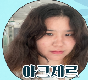
아크제르 카자흐스탄 국어국문학과 석사

전공 분야에 깊은 관심과 열정을 가지고 이곳에 입학한 저는 다양한 도전과 고난을 마주하면서도 저의 역량을 발전시킬 수 있는 기회를 얻을 수 있었습니다. 교수님들의 멘토링을 통해 저는 학문적인 깊이를 키우고 문제 해결 능력을 강화할 수 있었습니다. 대학원에서의 시간은 힘들기도 했지만, 그만큼 보람도 크고 성장할 수 있었습니다. 이제 저는 대학원에서 얻은 지식과 경험을 토대로 사회에 기여할 수 있는 연구자로서 해야 할 역할을 다할 것입니다. 마지막으로, 저의 대학원 생활에 도움을 주신 교수님들과 국제처 선생님들, 같이 수업을 들은 다른 대학원생분들께 감사의 말씀을 전하고 싶습니다. 제가 이곳에서 많은 배움과 성장을 얻을 수 있었던 것은 여러분들 덕분이었습니다. 앞으로도 지속적인 성장과 발전을 위해 노력할 것이며, 제 전문 분야에서 뛰어난 연구자로서 보답할 수 있도록 최선을 다하겠습니다. 감사합니다.